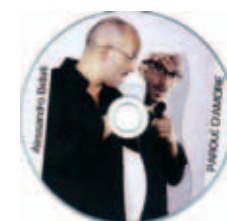
Alessandro Bellati PAROLE D'AMORE

Una conversazione con Giovanni Pannacci. Sono 85 pagine con le memorie della vita fin qui trascorsa nei suoi ottant'anni da Paolo Poli. Nelle poche pagine, al pari che in palcoscenico, ha messo tutto: la famiglia, gli amici, le ispirazioni, la cultura, il teatro, i successi, l'amata sorella Lucia, la radice toscana, la vocazione dissacratoria, le disinibizioni, le impudenze. Ci sono vestimenti e travestimenti; le mille identità; i boa di struzzo, i falpalà, le Sante e le Vamp. C'è la Firenze della giovinezza. Poli, in realtà, alla menzogna non ricorre mai. Più semplicemente, come gli piace dire, "mette le frange alla realtà". Per mutarla, tramortirla, parodiare, trasformarla in qualcosa d'altro, diverso e originale.