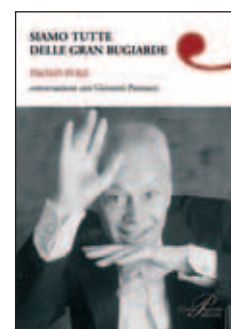
Paolo Poli SIAMO TUTTE DELLE GRAN BUGIARDE