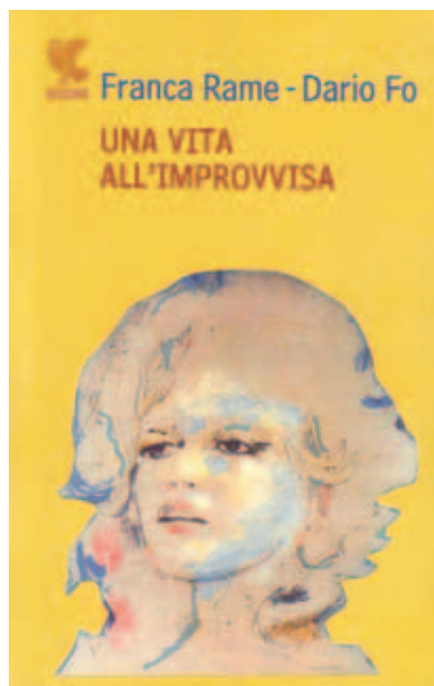
Dario Fo e Franca Rame UNA VITA ALL'IMPROVISA